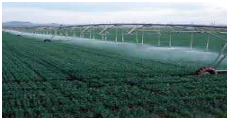
شکل ۵- کوددهی به روش نسبی در سیستم سنتر پیوت

برای سیستم های بارانی پیوسته نظیر سنتر پیوت، کود باید با روش نسبی بکار برده شود. در این روش هر سطحی از مزرعه در لحظه ای که سیستم بارانی به آرامی از آن نقطه عبور می نماید کود مورد نیاز را از طریق سیستم دریافت مینماید.