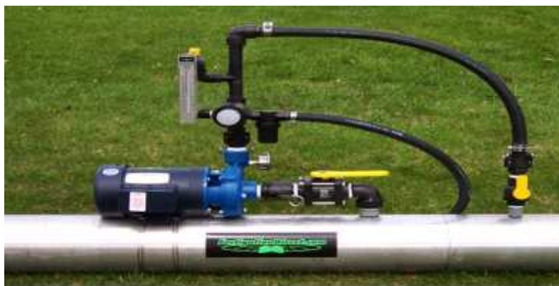
شکل ۶- تزریق کود با استفاده از روش پمپ کردن

می‌تواند به منظور تزریق مقادیر صحیح کود به مقدار کم یا زیاد طراحی و کالیبره شوند. پمپ محلول شیمیایی را از یک تانک رو باز کشیده و آن را با جابجایی یا فشار به داخل سیستم آبیاری تزریق می‌نماید. اگر سیستم قادر به تامین آب نبوده یا از کار بیفتد ممکن است جریان مواد شیمیایی برگشت نماید. از برگشت آب حاوی مواد شیمیایی به داخل منبع بایستی جلوگیری شود که برای این منظور می‌توان یک محفظه هوا و شیر یکطرفه بر روی خط اصلی آبیاری، در بالا دست جایی که مواد شیمیایی تزریق می‌شود، نصب نمود. یک شیر یکطرفه دیگر برای ممانعت از برگشت آب آبیاری و لبریز شدن تانک کود زمانی که پمپ تزریق در حال کار نمی‌باشد، باید روی خط لوله کود دهی نصب گردد. برای جلوگیری از تزریق کود در زمانی که پمپ آبیاری در حال کار نیست، اتصال بین پمپ آبیاری به عنوان یک عمل احتیاطی می‌تواند صورت می‌گیرد.