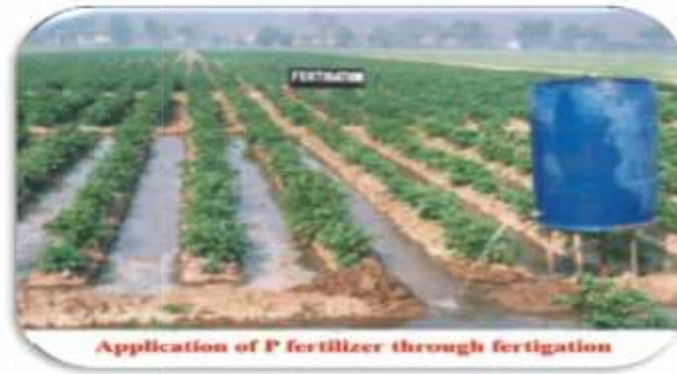
شکل ۲- کود آبیاری در روش آبیاری سطحی

در این روش معمولاً کود در داخل مخزنی ریخته می شود سپس از طریق شیر خروجی نصب شده روی مخزن و با تنظیم میزان کود مورد نیاز در مسیر نهر اصلی ، همزمان با آبیاری کود دهی نیز انجام می گیرد. یا بعضی از کشاورزان کیسه کود را در مسیر نهر اصلی جریان آب قرار می دهند که این روش مناسبی نمی باشد.