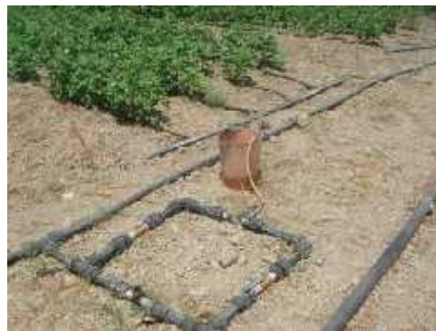
شکل ۷- کود آبیاری با روش اختلاف فشار (ونتوری)