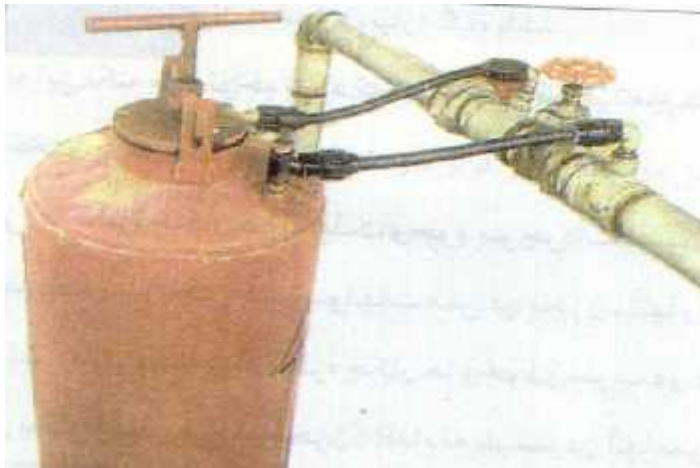
شکل ۱- استفاده از تانک کود جهت کود آبیاری

تزریق کود به آب آبیاری، شامل حل کردن کودهای محلول در آب و کاربرد آن از طریق سیستم های قطره‌ای و بارانی می‌باشد که روشی موثر، آسان و اقتصادی است. و مناسب بودن آن به شرایط خاک و محصول، روش آبیاری، کیفیت آب، نوع کود و مسایل اقتصادی بستگی دارد. این روش معمولاً در خاک‌های درشت بافت دارای امتیاز بیشتری نسبت به خاک‌های ریز بافت است. این مساله به نوع کود و چگونگی حرکت آن در خاک بستگی دارد.