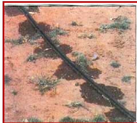
شکل ۳- کود آبیاری در روش های آبیاری تحت فشار