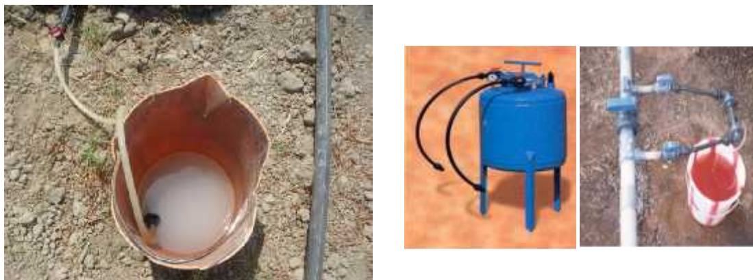
شکل ۴- کوددهی به روش گروهی

مرحله سوم: در مرحله شستشو به عنوان آخرین مرحله، زمان شستشوی کامل سیستم با آب معمولی برای جلوگیری از خوردگی باید به حد کافی طولانی باشد. در سیستمهای بارانی، گیاهان نیز با آب شستشو می شوند که شاید برای بعضی از محصولات، مهم باشد. شستشوی با آب به همین منظور معمولا حدود یک ساعت کفایت میکند.